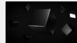
Teenuste portfelli (vaatamisõigusega)