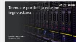
Teenuste portfelli tutvustav lühivideo